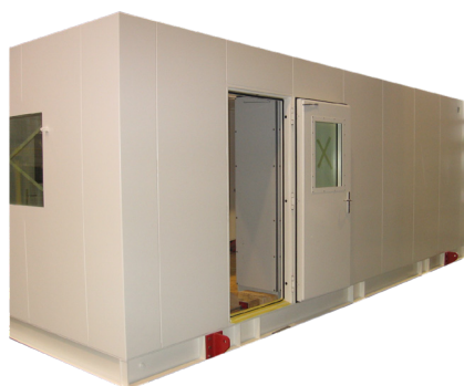
Wanden en deuren