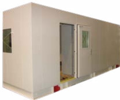
Wanden en deuren